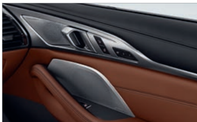
6F1 – Sistem de sunet Diamond surround Bowers & Wilkins

Imaginile sunt cu titlu de prezentare. Pot fi diferite față de realitate.