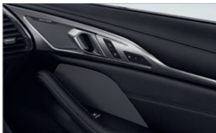
688 – Sistem de sunet surround Harman Kardon